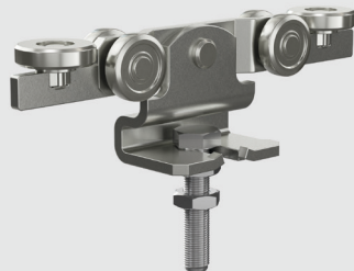
Doppelrolle mit Seitenführung